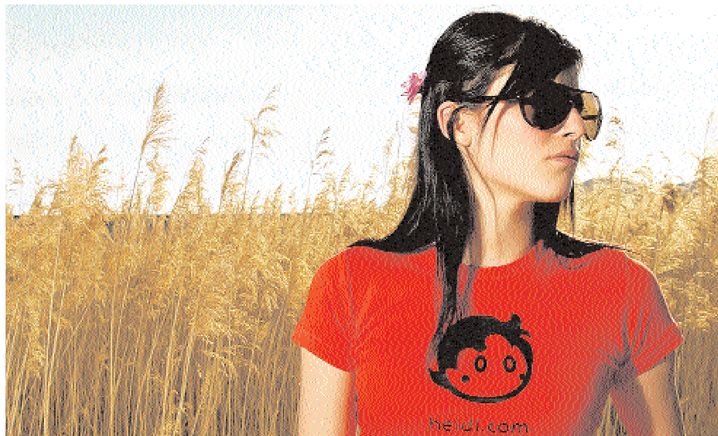
In keiner Kollektion fehlt das Original-Logo von heidi.com: für Mann und Frau.